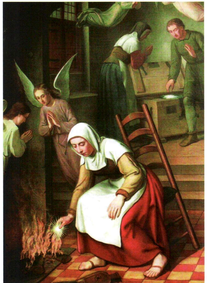
Het mirakel van Amsterdam

GE: In Utrecht vertel ik onder andere over de relieken van de Duitse keizer Koenraad II (+ 1039) die eeuwenlang in de Utrechtse Domkerk werden bewaard. Het hart en de